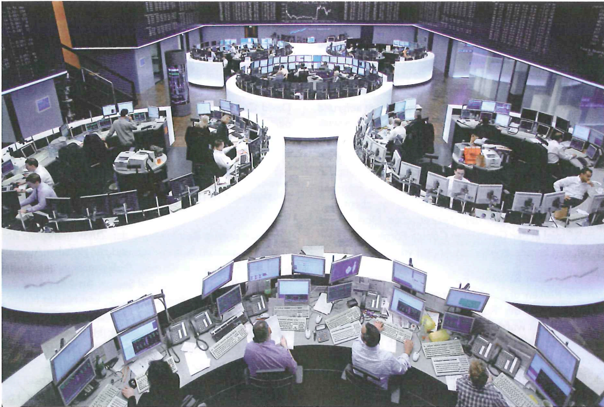
Handel Börse Frankfurt

Auch die berühmten „Garantie-Zertifikate“ von Lehman Brothers waren an sich vernünftig konstruiert, abgesehen von den zu hohen Gewinnmargen der vermittelnden Banken und Sparkassen. Dass Lehman Brothers als Vertragspartner ausfallen würde und deshalb ein Totalverlust eintreten könnte, hatte praktisch niemand in der Rechnung. Auch in den mathematischen Bewertungsverfahren für die Zertifikate wurde dieses institutionelle Ausfallrisiko in der Regel ausgeblendet; mithilfe der liquiden Credit Default Swaps (CDS) hätte man es zwar durchaus bewerten und absichern können, dies wäre allerdings auf Kosten der den Anlegern in Aussicht gestellten Rendite gegangen. Der Ausfall selbst hatte natürlich mehr mit politischen Weichenstellungen in den USA (und die bitteren Konsequenzen für viele Privatanleger in Deutschland mehr mit der Architektur der deutschen Einlagensicherung) als mit Mathematik zu tun.