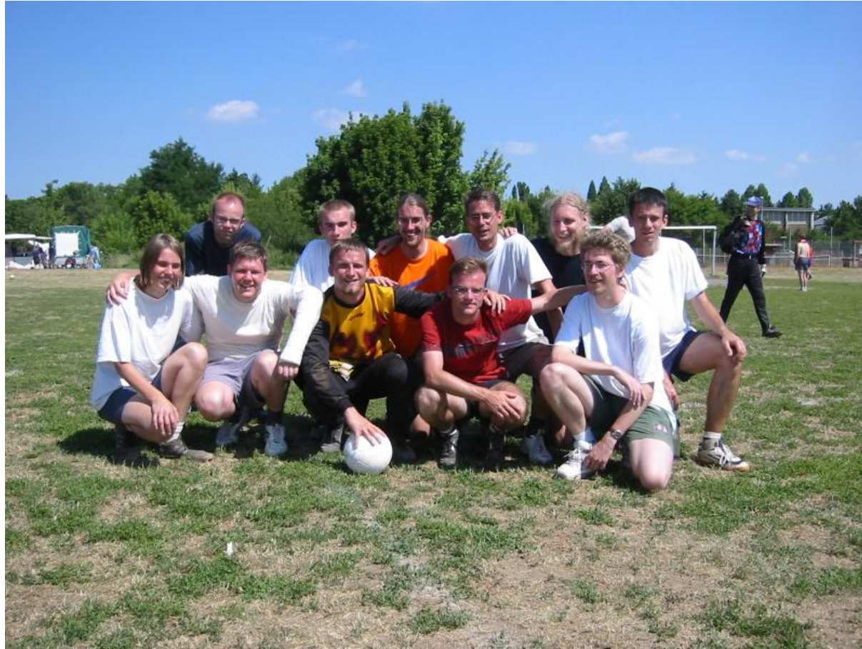
Das HUTU Team