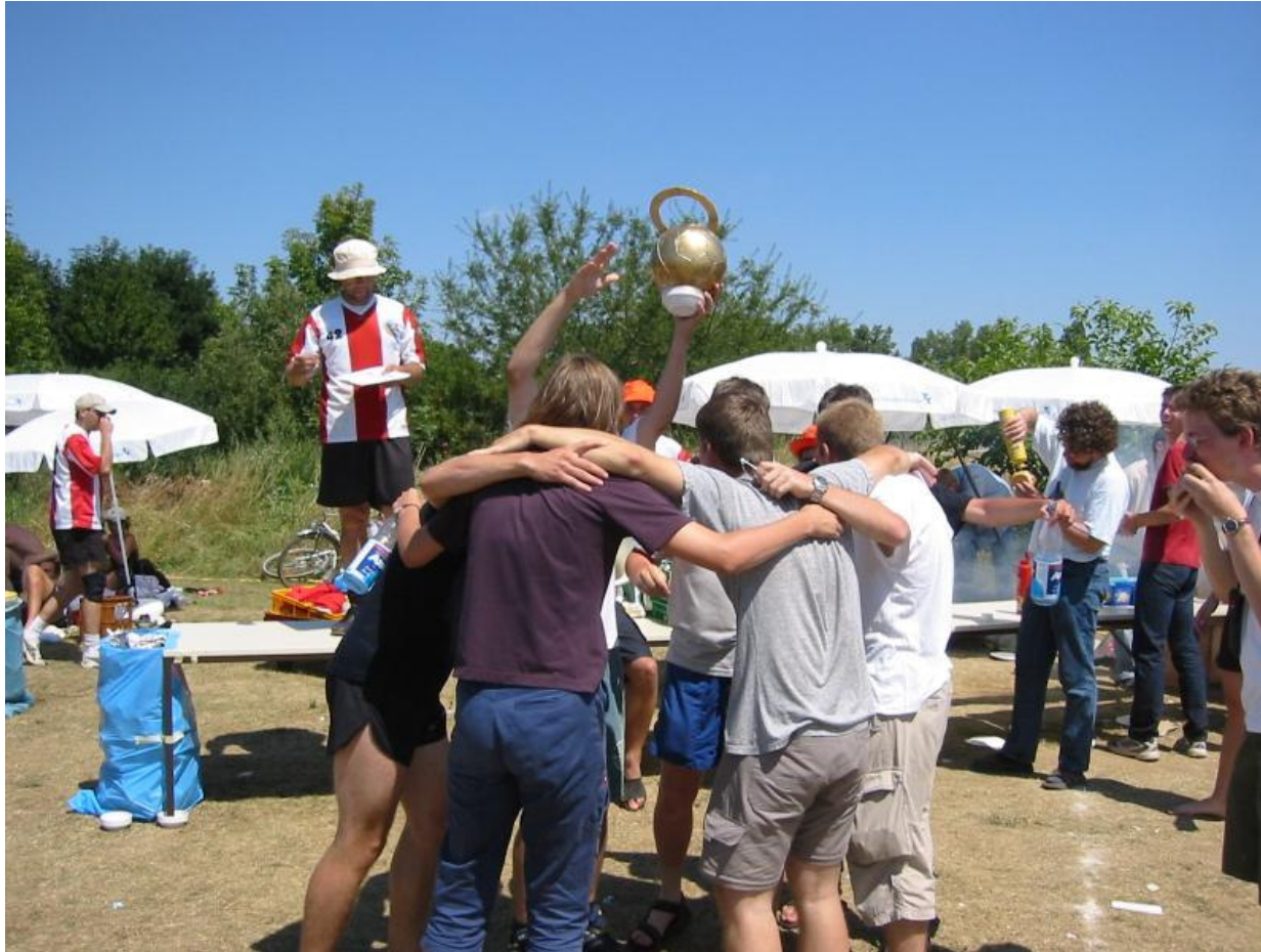
Der Jubel über den Gewinn des Fair-Play-Pokals.